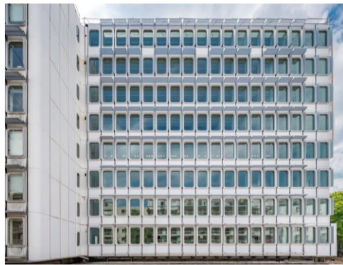
Unesco headquarters building V in Paris, Patriarche - Eckersley O'Callaghan