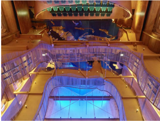
Queen Silvia Concert Hall, Stockholm - ©Roland Halbe